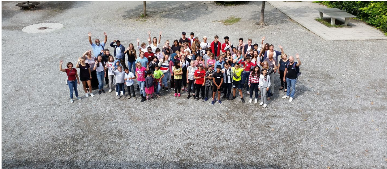
Unsere SommerschülerInnen 2019