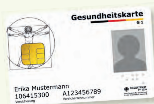
Musterbeispiel einer Gesundheitskarte

Bitte nehmen Sie immer Ihre elektronische Gesundheitskarte mit, wenn Sie Gesundheitsdienste in Anspruch nehmen. Seit dem 1. Januar 2015 gilt ausschließlich diese Karte als Berechtigungsnachweis, um Leistungen der gesetzlichen Krankenversicherung in Anspruch nehmen zu können. Auf der elektronischen Gesundheitskarte sind Ihr Name, Ihr Geburtsdatum und Ihre Anschrift sowie Ihre Krankenversicherungsnummer und Ihr Versichertenstatus (Mitglied, Familienversicherter oder Rentner) als Pflichtdaten gespeichert. Die elektronische Gesundheitskarte enthält außerdem ein Lichtbild von Ihnen.