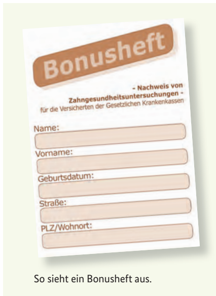
So sieht ein Bonusheft aus.

Gesunde Zähne sind ein Stück Lebensqualität. Deshalb sind regelmäßige Vorsorgeuntersuchungen wichtig – auch wenn Sie keine Beschwerden haben. Die gesetzlichen Krankenkassen übernehmen auch die Kosten dieser Vorsorgeuntersuchungen. Diese Untersuchungen helfen, bestimmte Erkrankungen frühzeitig zu erkennen und zu behandeln. Sie können dafür von Ihrer Krankenkasse ein sogenanntes „Bonusheft“ erhalten. In diesem Heft werden die Vorsorgeuntersuchungen eingetragen. Wenn Sie nachweisen können, dass Sie mindestens einmal im Jahr (unter 18 Jahren mindestens einmal pro Halbjahr) bei einer Zahnärztin oder einem Zahnarzt waren, zahlt die Krankenkasse einen höheren Zuschuss, sofern ein Zahnersatz notwendig wird.