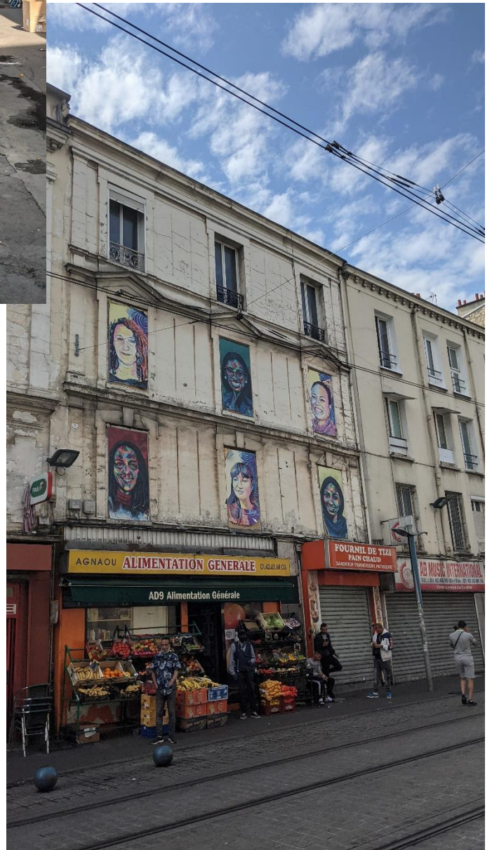
Abbildung 4 und 5 : diverse Streetart in Saint-Denis