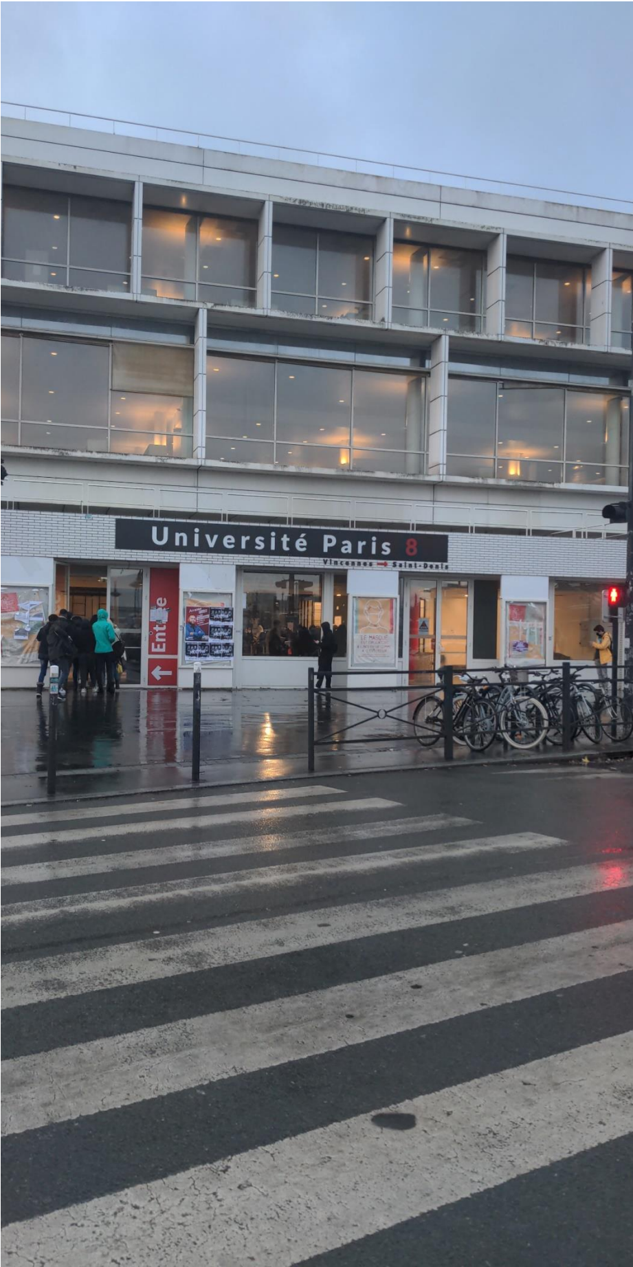
Abbildung 3: Die „Welt-Universität“ in Saint-Denis