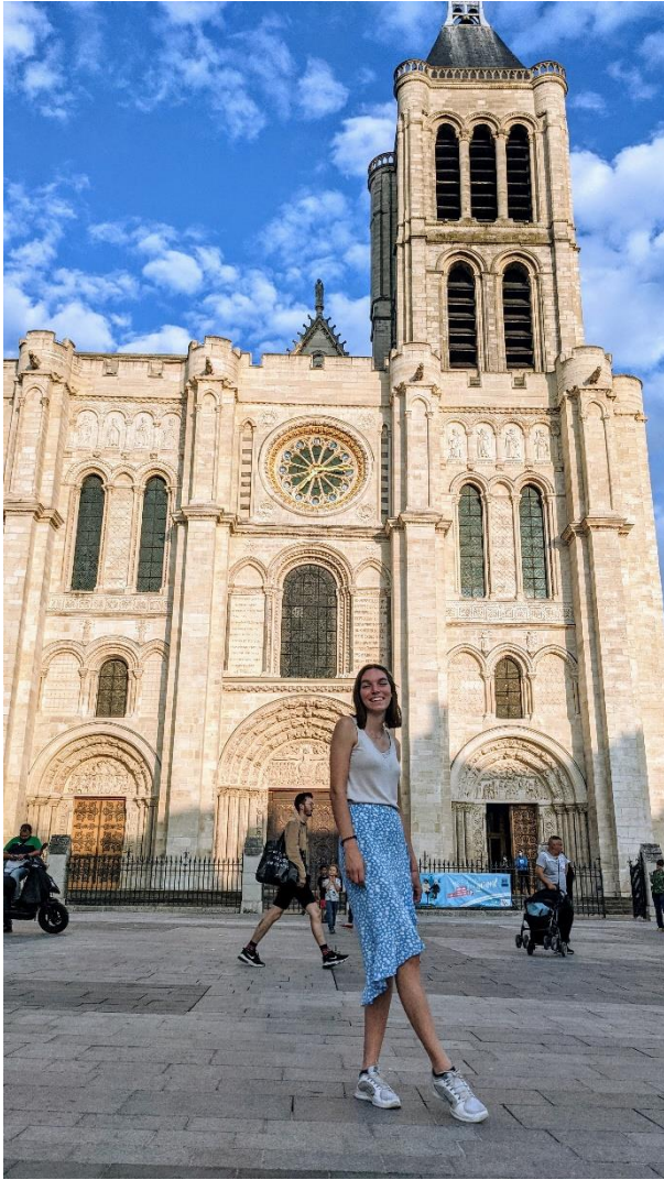
Abbildung 6: Die Basilique de Saint-Denis von außen