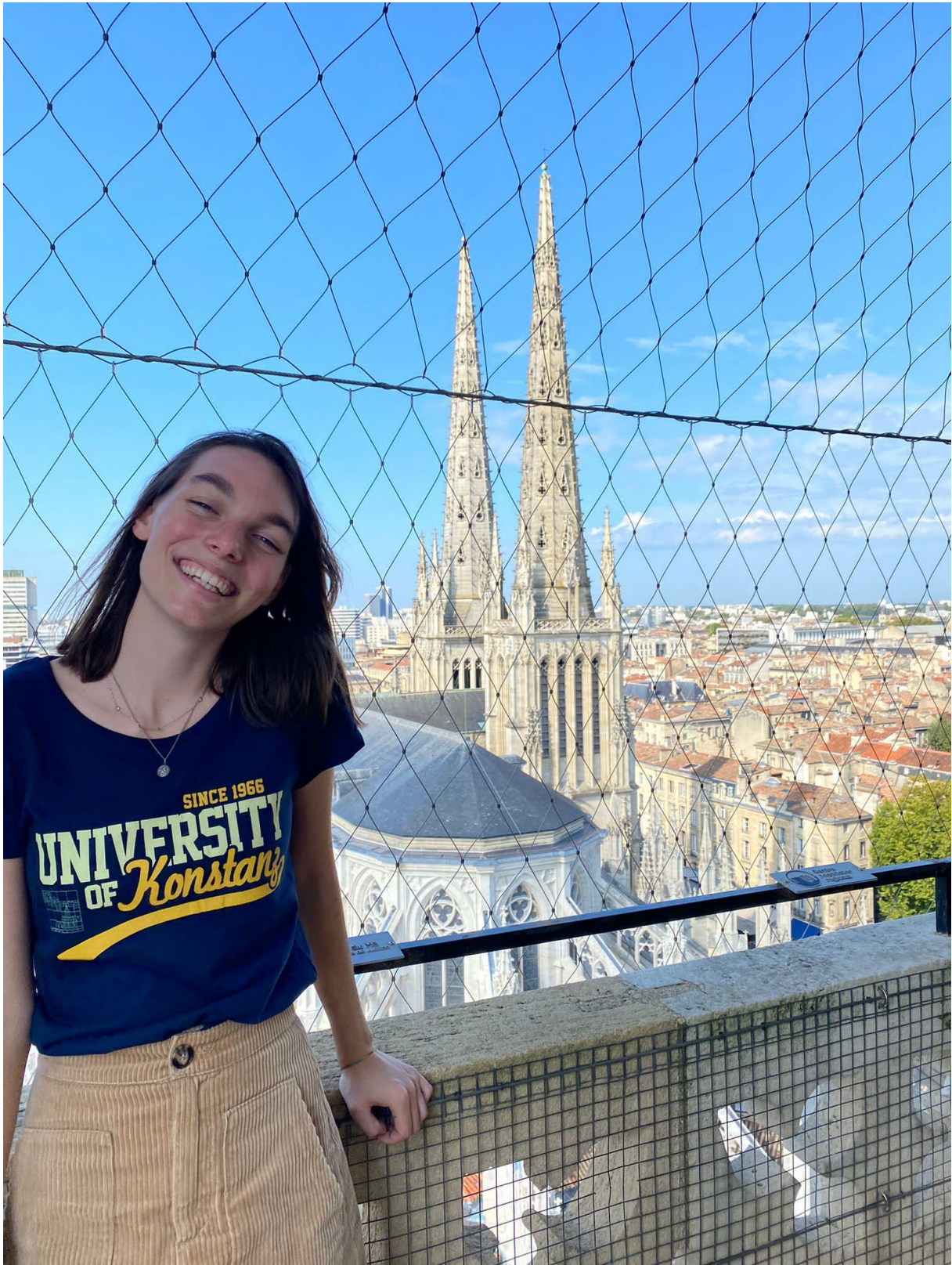
Abbildung 9: : Erasmus at it's best: Frankreich erkunden, hier Bordeaux