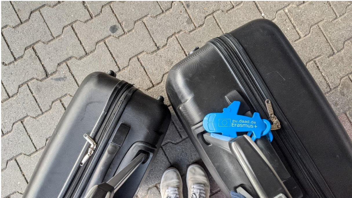
Abbildung 1: Mit meinen zwei Koffern warte ich auf den Zug, die Reise nach Paris kann beginnen!