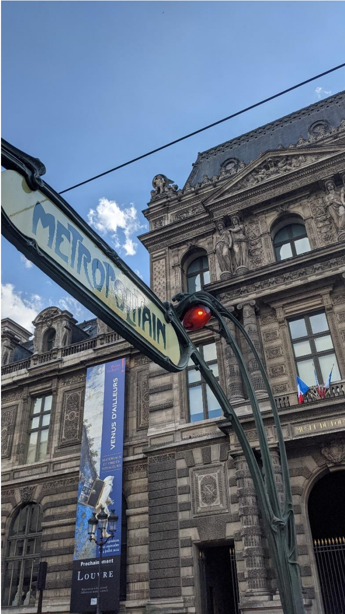
Abbildung 10, 11, 12, 13: Die Metro von Paris