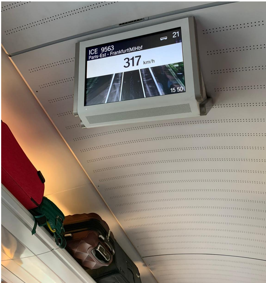
Abbildung 2: Hohe Geschwindigkeiten auf der Strecke zwischen Paris und Deutschland.